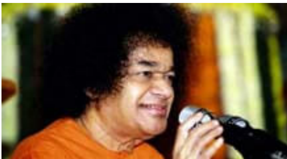
Sathya Sai Baba

Je souhaite que vous preniez les rênes de la direction et apportiez la paix et la prospérité à la nation en menant une vie idéale.”